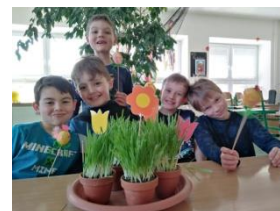
výroba dárečků a přáníček